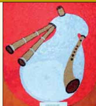
Vítaz v kategórii kolektívy