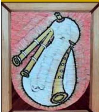
Vítaz v kategórii jednotlivci

Obec Jacovce vyhlásila súťaž „Originálny erb vyhráva“. Úlohou bolo zhotoviť netradičnou technikou a z netradičného materiálu erb obce. Aj touto formou sme chceli podporiť u detí ale aj dospelých záujem o obec a jej históriu. Do súťaže sa zapojilo 9 jednotlivcov a 15 erbov vyhotovili kolektívy. Práce boli vyhodnotené a odmenené 27.6.2014. Pre verejnosť budú vystavené v priestoroch ZŠ s MŠ do konca roku 2014.