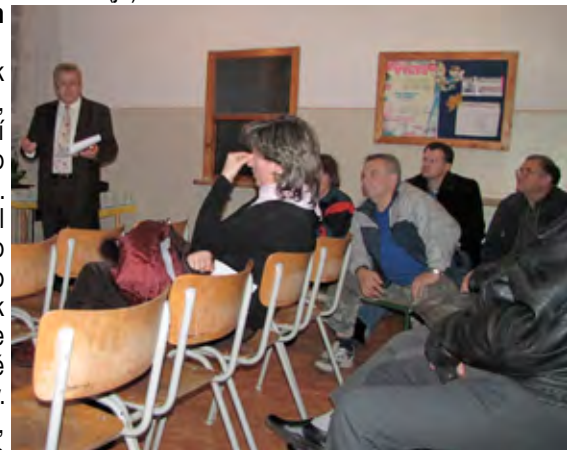
Z verejného zhromaždenia