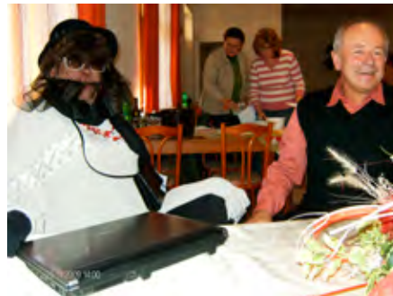
Teta z Ameriky so starostom obce Závada

- tak znela téma stretnutia reagujúca na celosvetovú hospodársku krízu. Mali sme za úlohu prešit model starých šiat podľa súčasnej módy a výsledok predviesť na móle. My sme pre istotu angažovali modelku až z ďalekej „Ameriky“. A aby bolo niečo aj na posilnenie, úlohou reprezentantov