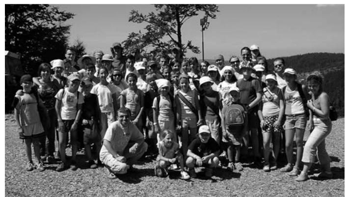
Stará Bystrica 2006