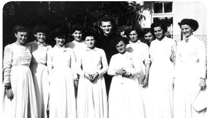
Pamätná snímka z primícií

Svätý otec Ján Pavol II. vymenoval 26. júla 1989 Mons. Jána Sokola za trnavského arcibiskupa a metropolitu Slovenska. Do tejto služby bol uvedený 10. septembra 1989. V roku 1995 bolo územie Slovenska rozčlenené na dve