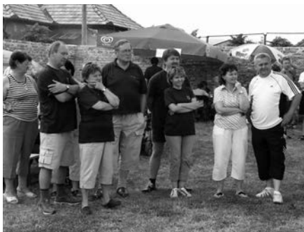
Hostia zo Skalitého v napätí

Súťažiaci mali na prípravu 3 hodiny. Po uplynutí tohto času bolo vyhodnotenie. 5 porotcov kontrolovalo, chuť, konzistenciu, ako aj farbu gu-