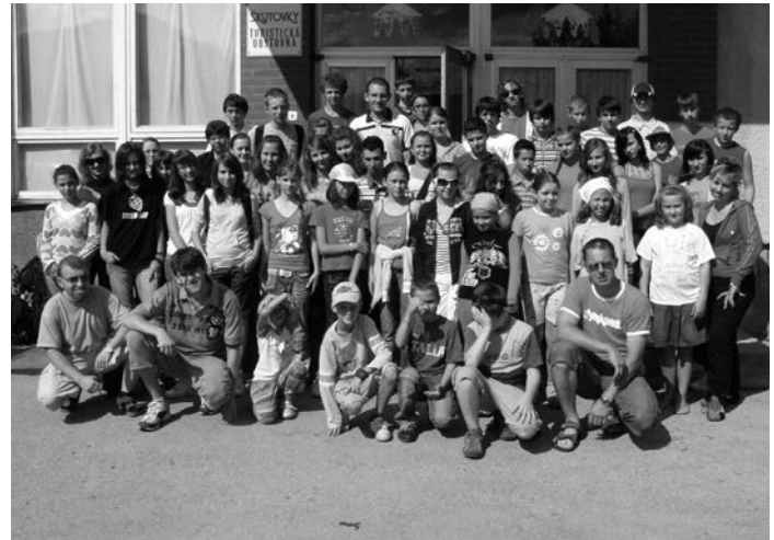
Liptovská osada 2008

Domov sme sa vrátili 18. augusta. Touto cestou chceme za pomoc poďakovať všetkým, čo venovali svoj čas a sily pred i počas pobytu, deťom za výbornú celotáborovú