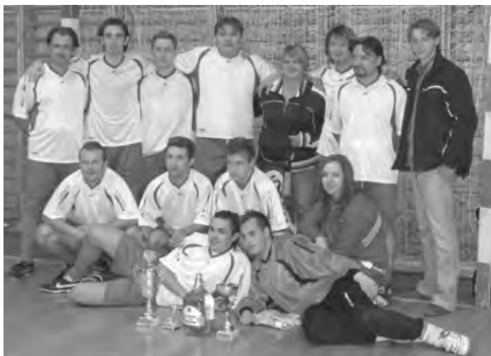
Víťaz ročníka 2006-2007 - mužstvo KLUB KLUB