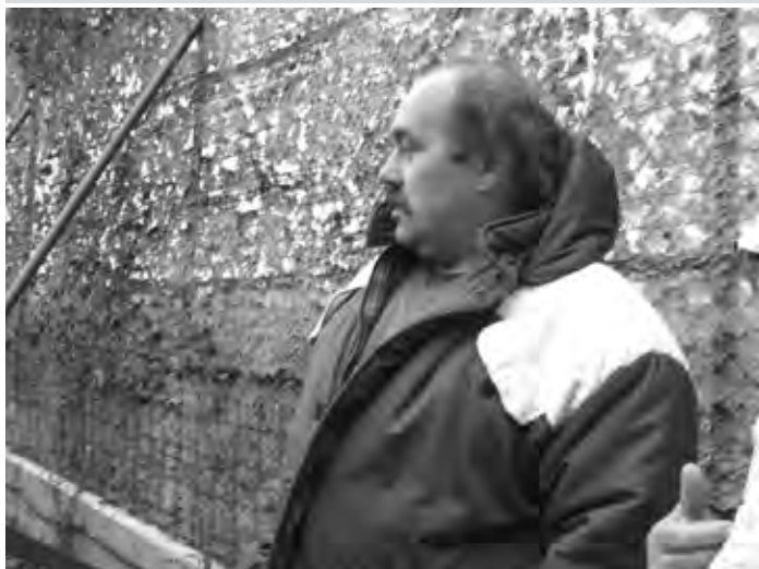
Otázka z titulku pre Luba Herpaya...