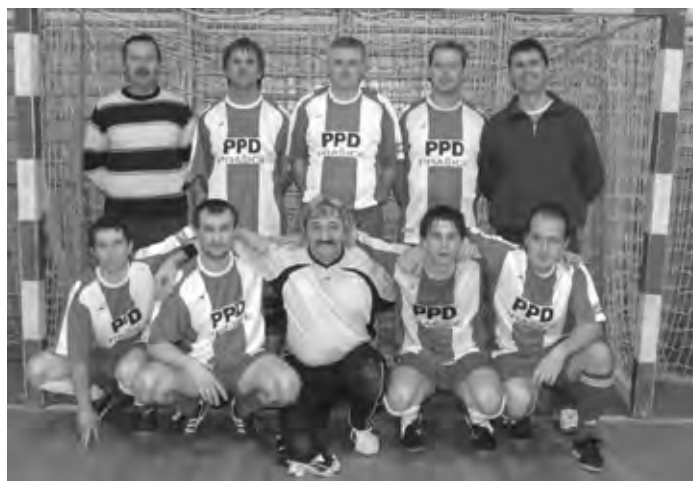
Tretí skončili PPD Prašice