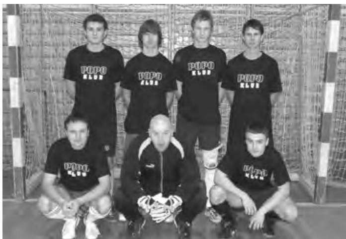
Druhé miesto patrí POPO KLUB-u