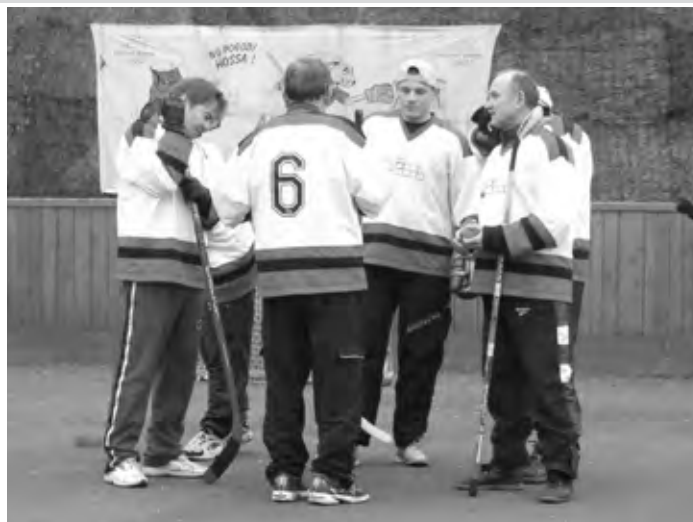
V prestávke novoročného turnaja